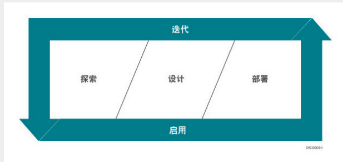
图 1. 红帽咨询解决方案交付框架

红帽咨询充分利用 SDF 中一系列产品和定制服务, 帮助企业优化对红帽企业 Linux 的使用。