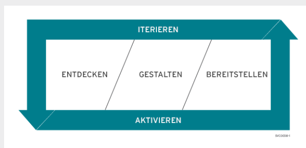
Abbildung 1. Service-Delivery-Modell von Red Hat Consulting

Red Hat Consulting begleitet Unternehmen durch diese Umstellung - mit einem auf Mentoring gestützten Ansatz, der Menschen, Prozesse und Technologie berücksichtigt. Mit einem Service-Delivery-Modell (solution delivery framework, SDF) helfen Experten von Red Hat den Kunden dabei, schnell, iterativ und strategisch Wert zu schöpfen und gleichzeitig unternehmensweite Fähigkeiten zu erlangen.