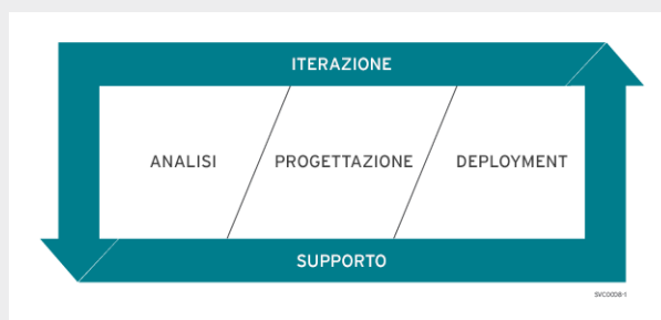
Figura 1. Solution Delivery Framework di Red Hat Consulting

Red Hat Consulting guida le aziende attraverso il processo di ottimizzazione offrendo un servizio di mentoring che tiene conto di persone, processi e tecnologie. Il Solution Delivery Framework (SDF) è il metodo rapido e iterativo utilizzato dagli esperti di Red Hat per aiutare le aziende ad acquisire un valore strategico e capacità applicabili in tutta l'azienda.