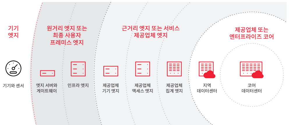
그림 1. 엣지는 다양한 활용 사례를 충족하기 위해 여러 위치와 티어에 걸쳐 있습니다.

Red Hat® 플랫폼과 기술은 함께 하이브리드 클라우드와 엣지 환경 전체에서 작동하는 유연하고 확장 가능한 공통 기반을 형성합니다. 주요 장점은 다음과 같습니다.