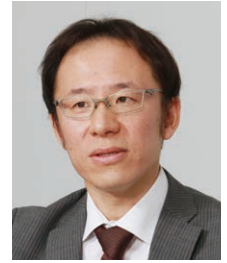
バイオニア株式会社 商品統括部 情報サービスプラットフォームセンター 開発部 開発1課 課長