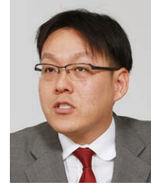
日本情報通信株式会社 ソリューションビジネス本部 クラウド・テクニカルセールス部 担当課長