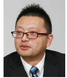
日本情報通信株式会社 ソリューションビジネス本部 クラウド・テクニカルセールス部 先進テクノロジーグループ