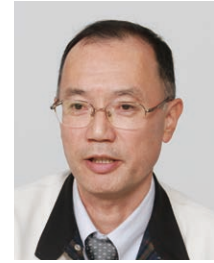
バイオニア株式会社 商品統括部 情報サービスプラットフォームセンター 開発部 部長