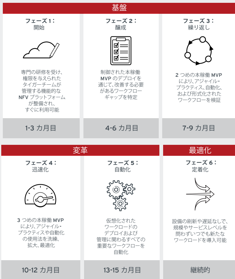
図 1：NFV 導入の工程

NFV 導入プログラムは、NFV 環境の導入と運用を単純化、体系化、自動化するフェーズ別アプローチを提供します。これにより、仮想化ネットワーク機能（VNF）を効果的にデプロイするためのアーキテクチャ基盤および運用基盤を構築し、イノベーションを推進する強力な企業文化を確立できます。