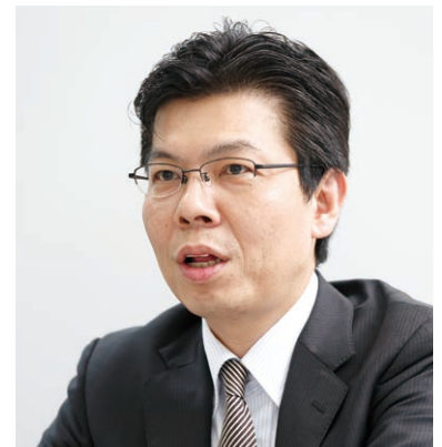
松井証券株式会社 取締役 システム部担当役員

「Linux OSを中心にOSSを積極的に採用してきましたが、ミッションクリティカルな領域へのOSSのミド