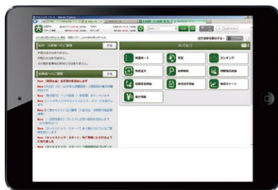
ネットストック・スマートは、 ソフトウェアダウンロード不要でWebブラウザから使える

システムの安定稼働はより良い利便性を支えるものであり、競争優位の重要なポイントになる。佐藤氏が懸念していたのは、Webアプリケーションサーバーの高負荷だった。